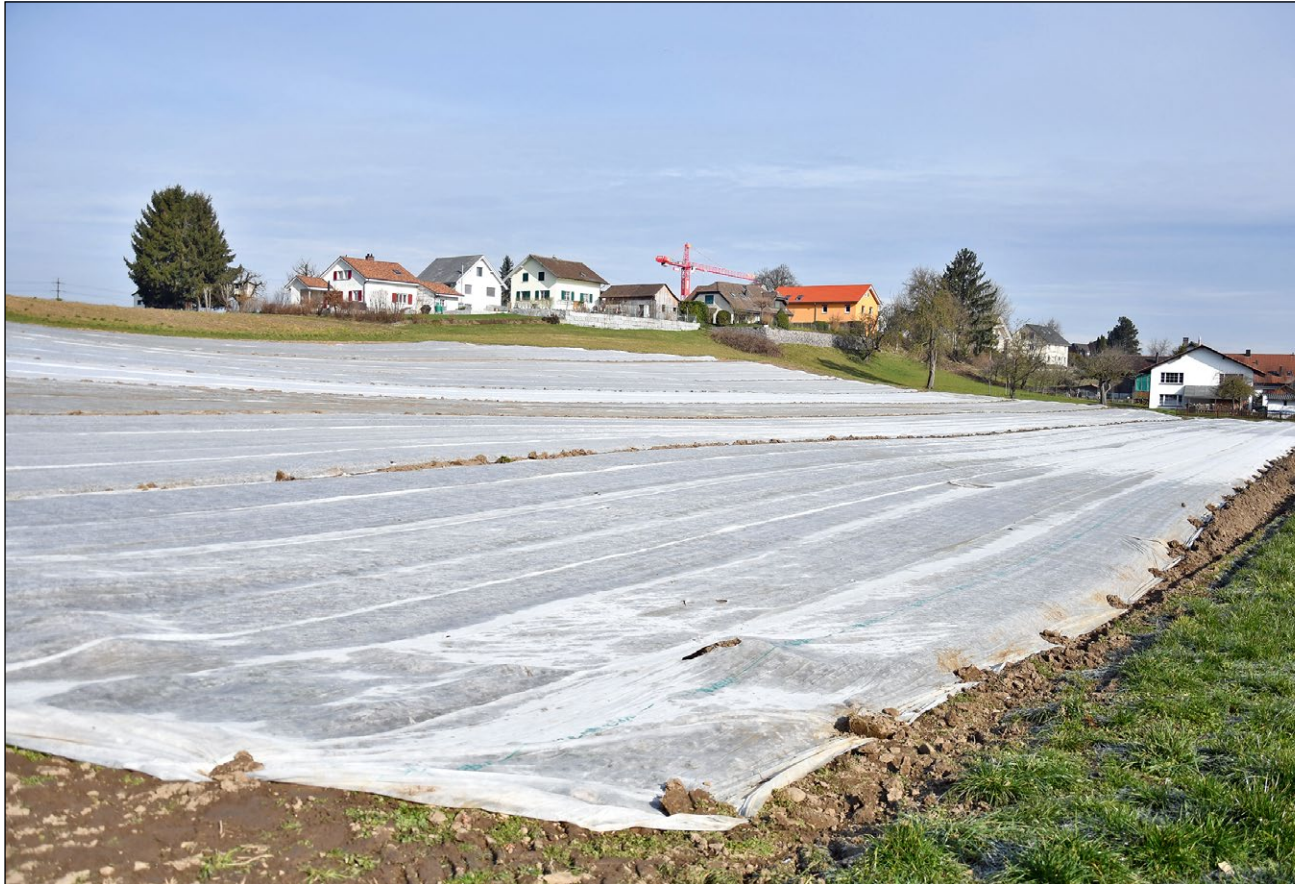
Hier sollen auf einer Fläche von gut einer Hektare zweigeschossige Mehrfamilienhäuser gebaut werden.